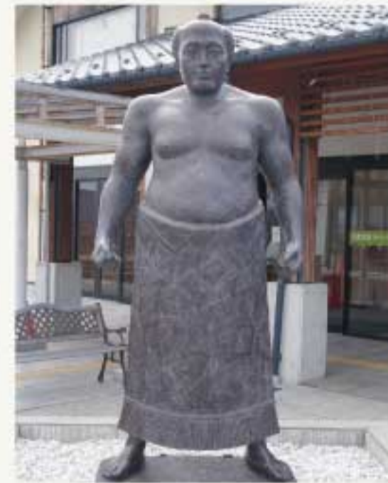
道の駅「雷電くるみの里」(東御市)にある雷電の銅像。同施設内には資料館、また近隣には復元されて一般公開されている生家もある。