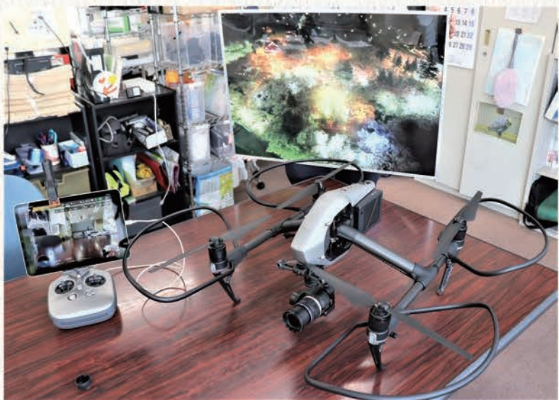
▲ 信濃毎日新聞のカメラマンが所有する小型無人機ドローンの本体(右)とコントローラー。奥はドローンで撮影した高遠城址公園の上空からの写真

小型無人機ドローンによる上空からの撮影が新聞報道でも威力を発揮しています。単に目標より高い位置からの撮影のみならず、鳥の目やニュースに迫る可能性も秘めています。これからの報道では、写真に加えて、紙面を起