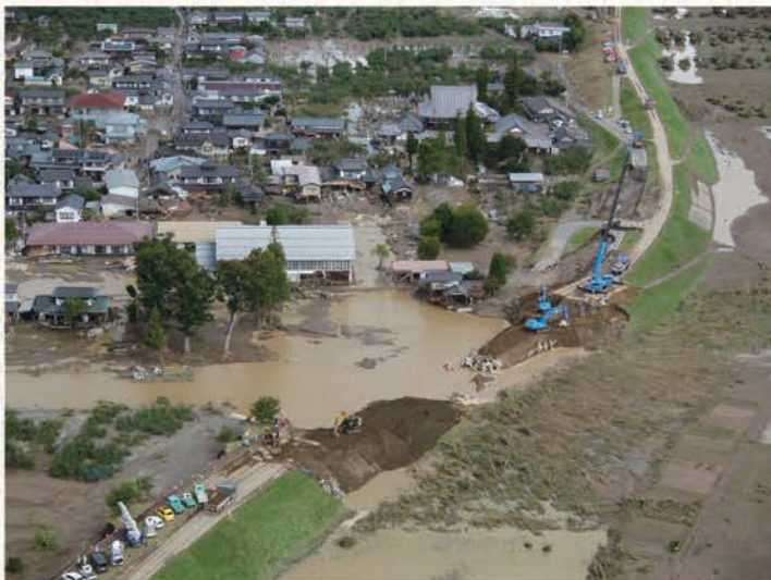
▲ 小型無人機ドローンで撮影した長野市の千曲川の堤防決壊現場 (2019年10月16日付 信濃毎日新聞朝刊1面より)

書にはサッカーの試合をアップとルーズで撮影した写真が載っています。ゴールを決めた選手のアップ写真は、全身喜びを表す姿をとらえています。試合が終了した直後に勝利チームの応援席を写したルーズ写真は、観客と選手が一体となって沸く様