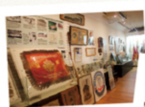
（上）松商学園 歴史栄光室には、中島さんに限らず、同校のこれまでの活躍の証が所狭しと並ぶ

現在、松商学園には中島が三冠王をとった当時に、その1つの最高打撃賞で贈られた「盾（たて）」が寄贈され、展示されています。また来年の同校の創立120周年にあわせて、中島の記念の銅像が製作される計画もあるといいます。偉業を間近に感じて送る学校生活の中で、近い将来、中島を継ぐ選手が誕生するかもしれませんね。