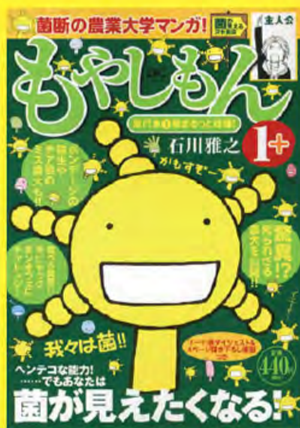
『もやしもん』 © 石川雅之 / 講談社 419円（税別）ほか