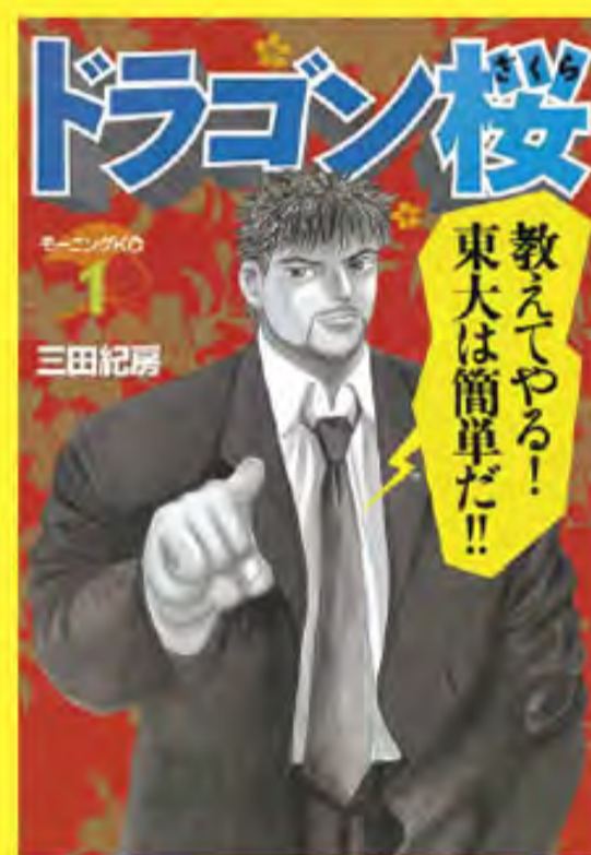
『ドラゴン桜』 © 三田紀房 / 講談社 610円（税別）