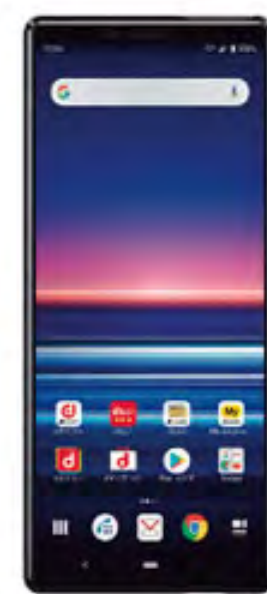
(c)Xperia 1 SO-03L