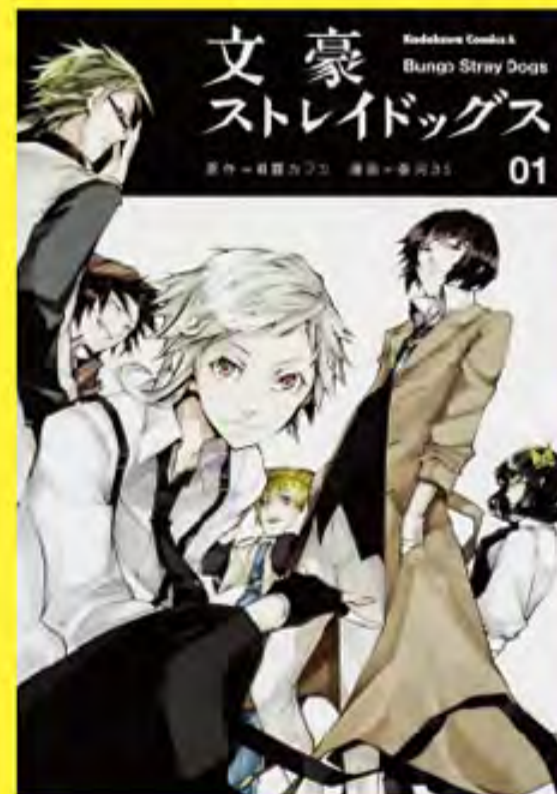
『文豪ストレイドッグス』 © 原作：朝霧カフカ 漫画：春河35/ 発行：株式会社KADOKAWA 560円 (税別)

横浜を舞台に、中島敦、太宰治、芥川龍之介といった作家(=文豪)たちが活躍する異能アクションバトル漫画。実際の作品名がついた技や能力を使い、人物設定も本当のエピソードにちなんだものが多いため、作家と作品を結びつけて理解するのに役立ちます。キャラクターはみな“イケメン”だが、その辺のリアルさは、文学史を見て確認しましょう。シリーズ累計750万部を突破し、小説やアニメなど様々なメディアミックスも展開中。